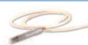
Manipolo per la Microdermoabrasione.

Grazie alla Dielettroforesi Transdermica, utilizzando specifici principi attivi opportunamente scelti è possibile trattare smagliature , ipotonie muscolari, ipotonie tissutali, invecchiamento cutaneo biologico e da luce solare.