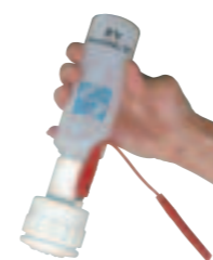
Manipolo per la Dielettroforesi Transdermica.