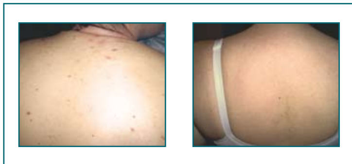
Caso 2: prima e dopo il trattamento