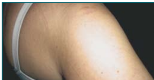
Caso 2: prima e dopo il trattamento