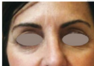
Prima e dopo trattamento con Sublative Matrix RF frontale e periorbitario