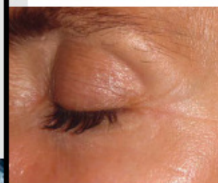
Prima e dopo trattamento con Sublative Matrix RF periorbitario

periorbitale per 2 volte. Il tempo di guarigione è stato di 4-6 giorni, caratterizzato da lieve eritema e formazione di minuscole crosticine inferiori a 1 mm di diametro, facilmente copribili con il trucco. Dopo il secondo trattamento, 10 pazienti sono state operate di blefaroplastica inferiore per via congiuntivale. Sono state escluse le pazienti che avevano effettuato trattamenti ablativi, filler e botox nei 6 mesi precedenti. Sono stati compilati i consensi informati e si è provveduto anche alla documentazione fotografica per ciascuna seduta. Si è valutato il grado di soddisfazione, considerando vari parametri, al termine di ogni seduta e 2 mesi dopo l'ultima seduta.