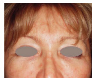
Prima e dopo trattamento con Sublative Matrix RF periorbitario e viso intero

quanto riguarda la qualità (levigatezza, compattezza, texture, luminosità): è come avere muri perfetti ma rivestiti da una brutta tappezzeria!